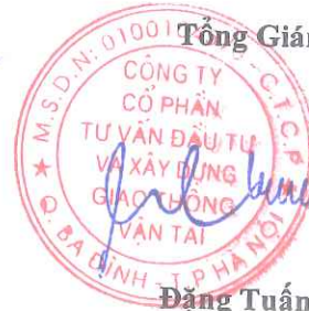
Đặng Tuấn Cường